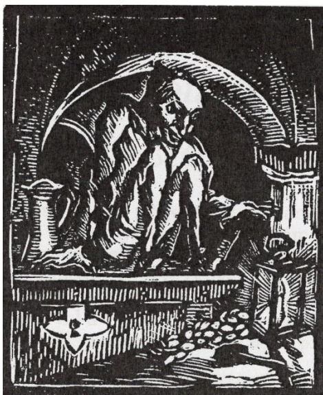
Klepáček z Kazdových pověstí

různým výročím (Sto let Spolku divadelních ochotníků v Berouně či Čtyřicet let berounského odboru Klubu čl. turistů) nebo významným událostem (Do základního kamene berounské okresní nemocnice či K zahájení činnosti Okresního úřadu v Berouně). Jakožto milovník hudby a nadšený houslista se věnoval také hudebním osobnostem našeho kraje, jako byli Josef Leopold Zvonař, Josef Slavík, ale i Bedřich Smetana. Mnoho článků vydal v Hlasech od Berounky.